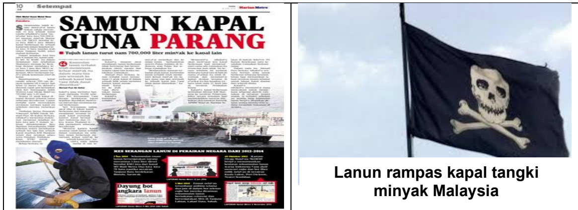
Lanun rampas kapal tangki minyak Malaysia

3. Berita berikut memaparkan kes pencerobohan lanun di kawasan perairan negara.