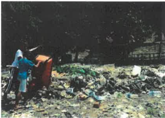
PEMBUANGAN SAMPAH SARAP