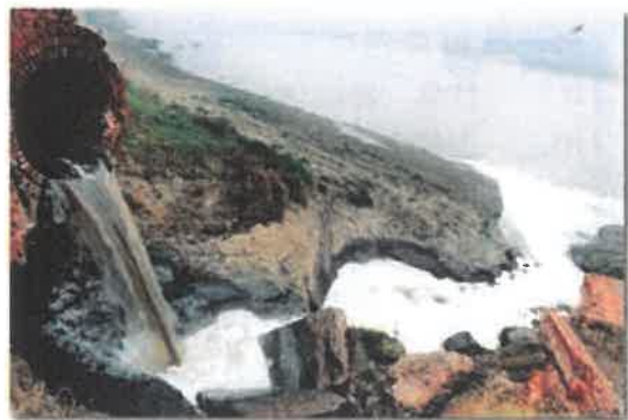
PEMBUANGAN SISA DARIPADA KILANG