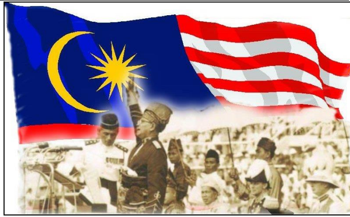
Bapa Kemerdekaan Tunku Abdul Rahman mengisytiharkan Kemerdekaan Tanah Melayu pada 31 Ogos 1957

Gambar di atas menunjukkan detik Tanah Melayu mencapai kemerdekaan pada 31 Ogos 1957. Setiap tahun, seluruh rakyat Malaysia menyambut Hari Kemerdekaan negara dengan pelbagai aktiviti seperti mengibarkan Jalur Gemilang, perarakan dan kereta berhias.